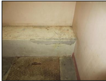
Photo N° 936 AMIANTE CIMENT -- ESCALIER RDC à -1 Gainses & coffres verticaux Ventilation basse (Fibres-ciment)