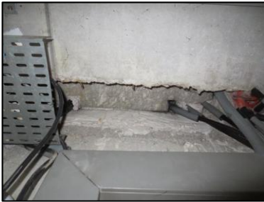
Photo N° 926 AMIANTE CIMENT -- PLACARDS TECH -1 à +4 Plafonds Plaques planes (Fibres-ciment)