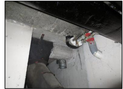
Photo N° 940 AMIANTE CIMENT -- LOCAL VO -1 Plafonds Coude de ventilation haute (Fibres-ciment)